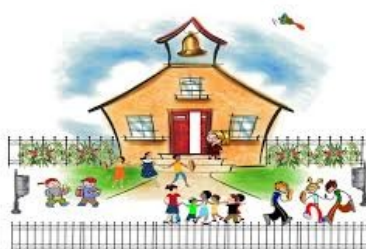
Τύσο όλοι θα φάμε και θα παίξουμε!